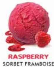
RASPBERRY SORBET FRAMBOISE