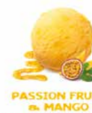
PASSION FRUIT & MANGO SORBET FRUIT DE LA PASSION & MANGUE