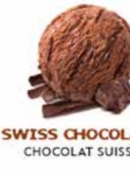
SWISS CHOCOLATE CHOCOLAT SUISSE