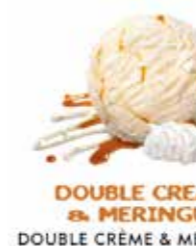
DOUBLE CREAM & MERINGUE DOUBLE CRÈME & MERINGUE