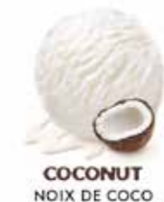
COCONUT NOIX DE COCO