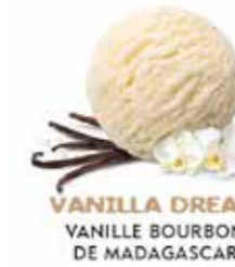
VANILLA DREAM VANILLE BOURBON DE MADAGASCAR