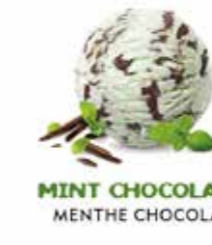
MINT CHOCOLATE MENTHE CHOCOLAT