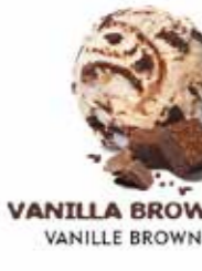
VANILLA BROWNIE VANILLE BROWNIE