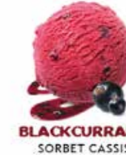
BLACKCURRANT SORBET CASSIS