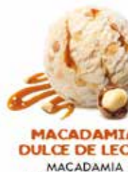
MACADAMIA DULCE DE LECHE MACADAMIA DOUCEUR DE LAIT