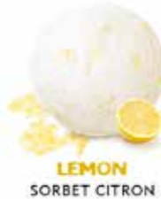
LEMON SORBET CITRON