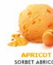
APRICOT SORBET ABRICOT