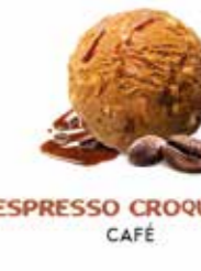
ESPRESSO CROQUANT CAFÉ