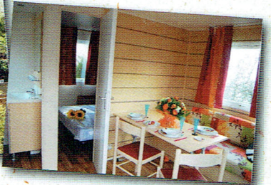
* En basse saison